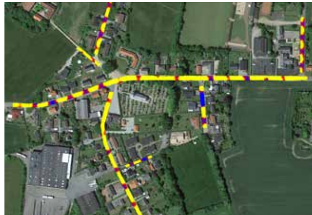
Den visuelle præsentation giver Viborg Kommune indblik i lysmængden.

- Hvis det viser sig for kommunen, at der i gennemsnit kan skrues 40-50 procent ned for lyset i hele kommunen, så er der jo mange penge at spare, siger han.