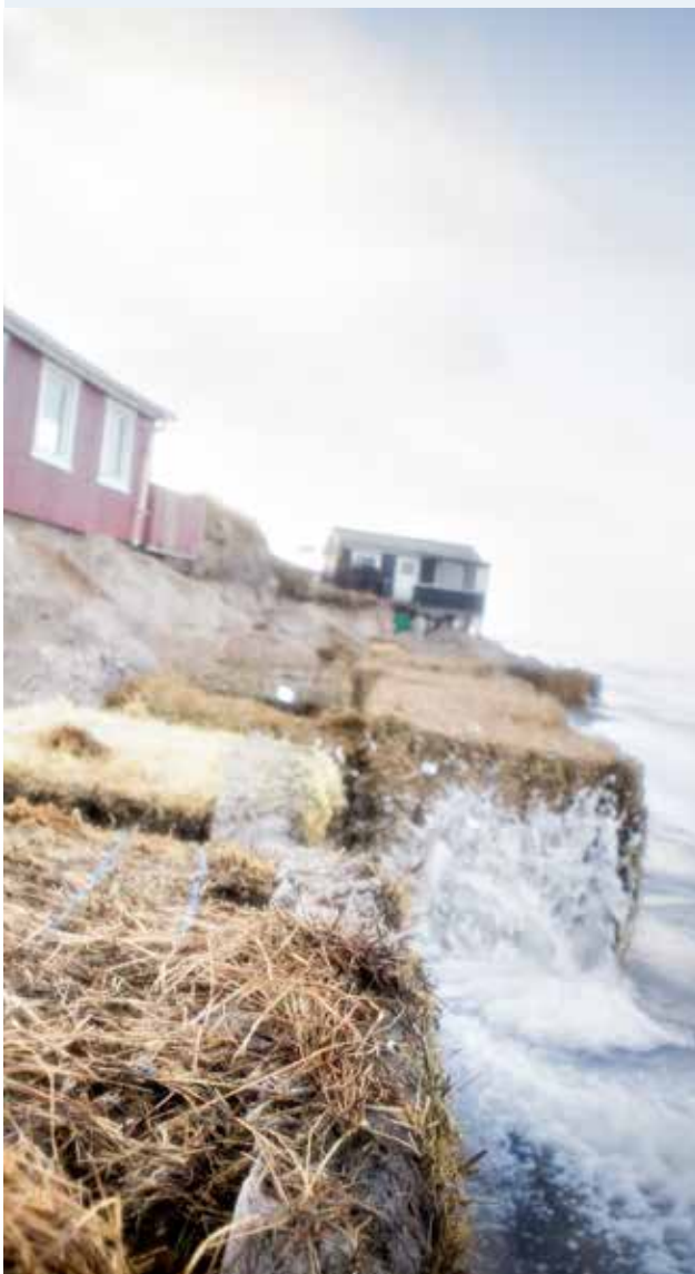
Miljø og fødevarerminister Esben Lunde Larsen anklages for at vildlede Folketingets miljø- og fødevarerudvalg om sagsbehandlingstiderne for kystbeskyttelsessager.

Lokale 2-133 på Christiansborg kl. 14.00