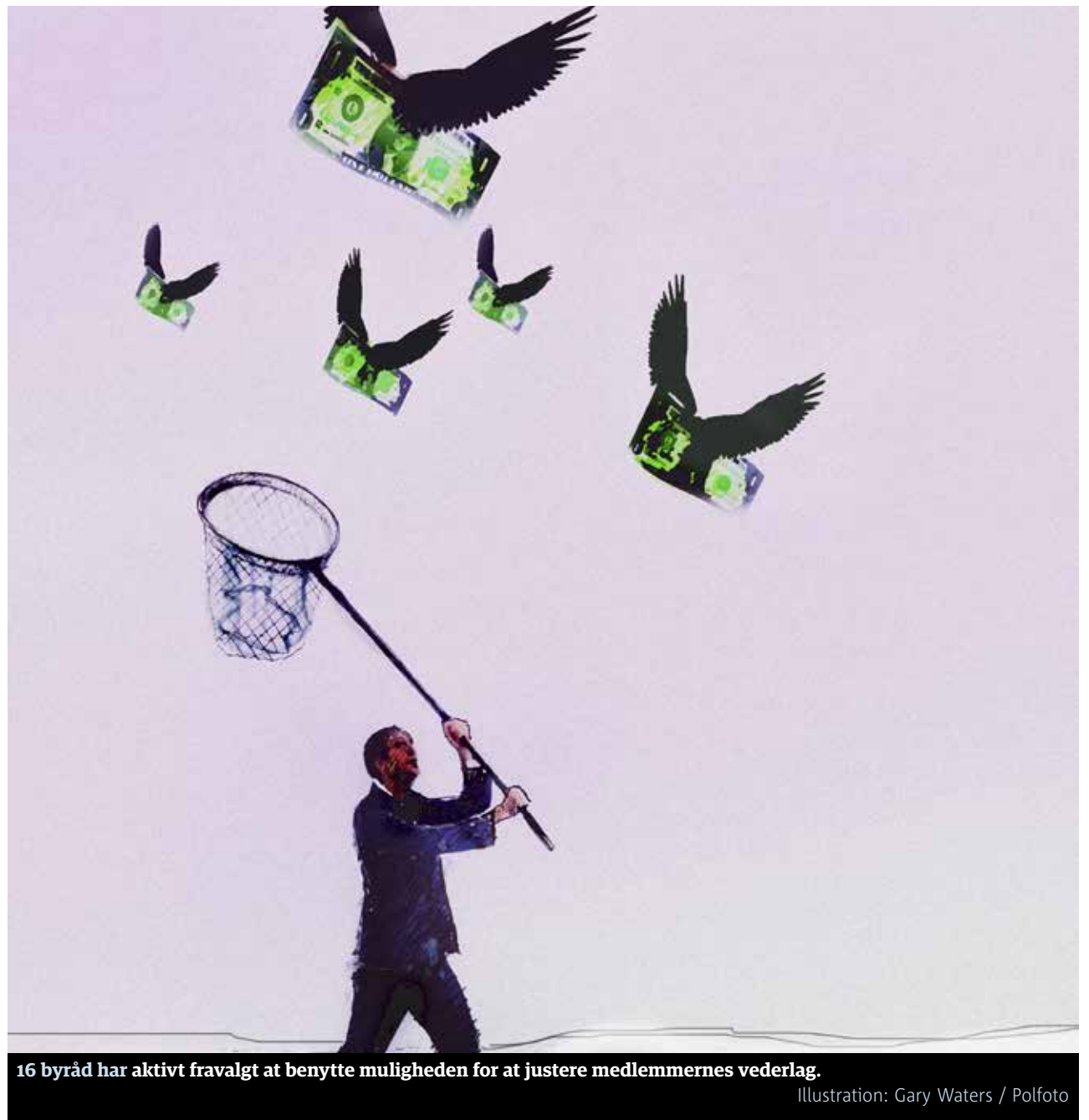
16 byråd har aktivt fravalgt at benytte muligheden for at justere medlemmernes vederlag.