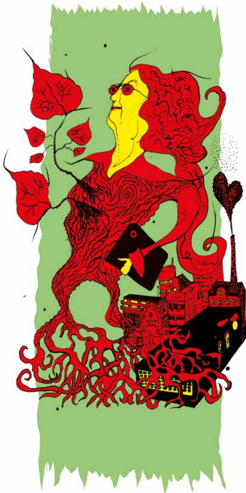
ILLUSTRATION: IB KJELDSMARK

Hvorfor tog jeg den ikke bare med ro og droppede ambitionerne? Fordi jeg gerne ville