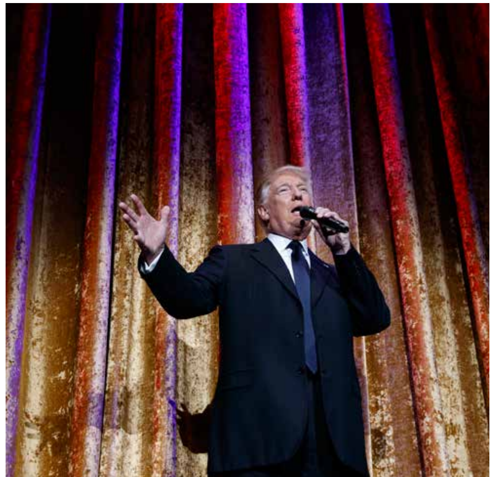
'Onkel Kurt' i fri udfoldelse. Morten Uhrenholdt skriver om figuren 'Onkel Kurt', som gerne holder tæller for andre, men også hurtigt får den drejet over i beskrivelser af eget lysende talent. Han kom til at tænke på Onkel Kurt, da han så Donald Trumps pressemøde.

Den anden del af mistanken nævnte han ikke med et ord. Nemlig at hans stab under den beskudte og måske russer-hackede valgkamp skulle have stået i hyppig nærkontakt med Putins håndgangne mænd. Det er en mistanke, der - hvis der viser sig at være kød på den - kan blive en rigtig alvorlig sag for manden.