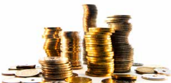
ILLUSTRATION: RASMUS MEISLER

14 procent af de kommunale chefer føler sig chikaneret eller bagtalt af politikere side 10-11