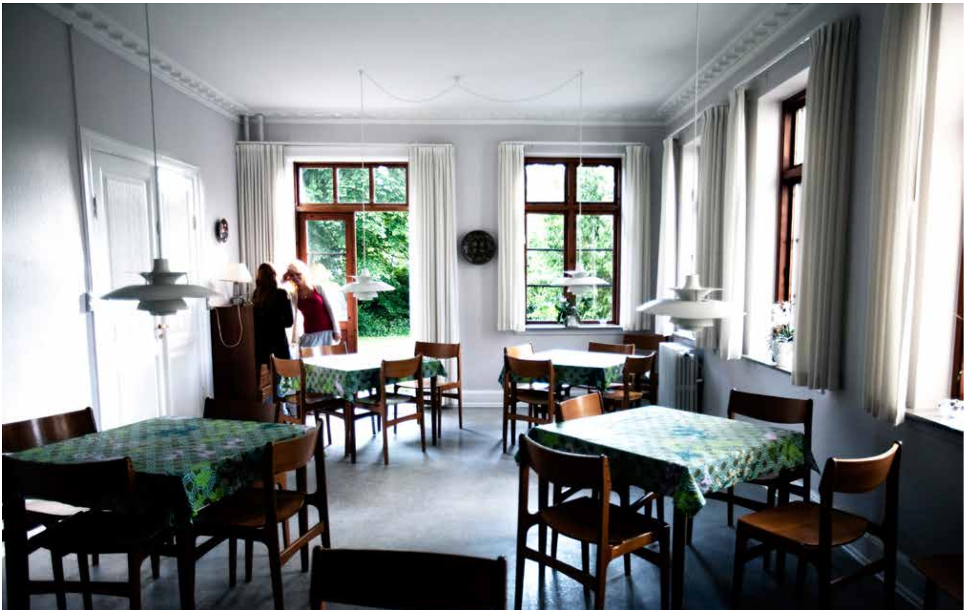
Sjællandske kommuner vil udlicitere støtte til udsatte unge. Det er dog ikke lige så enkelt at konkurrenceudsætte en broget gruppe mennesker med vidt forskellige udfordringer, som det er at sende tekniske opgaver i udbud.