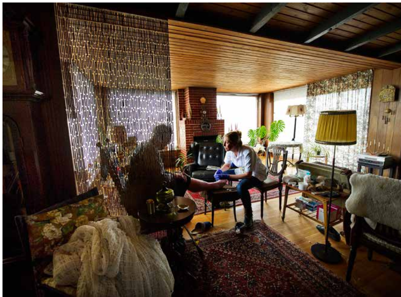
Syge borgere og deres pårørende kan få hjælp af velfærdsteknologien. Men på mange områder er teknologien længere fremme end lovgivningen, og der er etiske dilemmaer at tage stilling til.