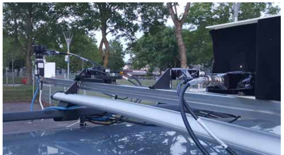
Bilens indsamlingsteknik består af otte lyssensorer, to kameraer og gps-udstyr. Når teknikerne har brugt 30 minutter på at montere og kalibrere bilens sensorer, er bilen klar til at indsamle lysdata med op til 120 km/t.

”På nogle strækninger var der over 200 procent for meget lys. Vi har også målt kommuner, der ikke har haft nok lys på vejen og derfor ikke lever op til regulativerne.”