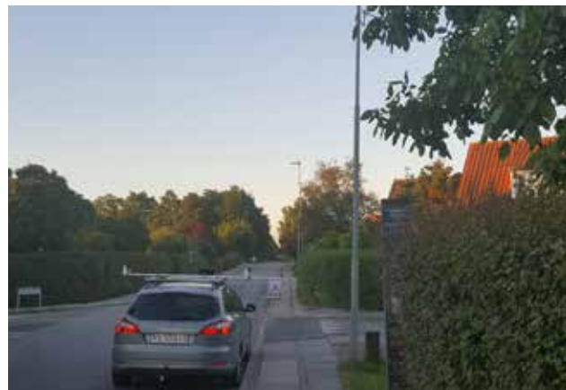
Virksomhedens bil kan foretage kontrolmålinger for hele strækninger med 50 til 100 lamper indenfor kort tid.